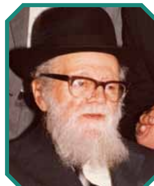
הרב שאול ישראלי