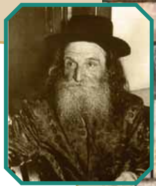
הרב הנזיר - דוד כהן

באותה התקופה היה זה רצי"ה חברותי" המשתתף בכל שמחה של תלמידיו, באירוסין, בחתונה, בברית או בר מצוה, בנסיעה להכתרה לרב של אחד מתלמידיו, או לחנוכת בית כנסת ביישוב חדש, ולא רק בירושלים אלא בכל מקום בארץ ישראל. היה זה רצי"ה מלא שמחת חיים כשהוא מקדם בבת שחוק את מי שנפגש עמו, אין פלא שהתלמידים שגדלו בסביבתו באותם הימים סיגלו לעצמם את התכונות הללו בהתנהלותם והנהגתם, להיות אנשים ידידותיים אוהבים ואהובים לבריות, ללא התנשאות וללא פסילת הזולת. תלמידים שרבנו טיפחם וגידלם למעלה מעשר שנים, לאחר שהתגדלו בתורה עזבו את הישיבה ויצאו לבנות