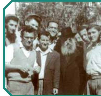
הרצי"ה עם תלמידיו