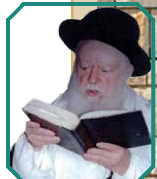
הרב אברהם שפירא